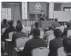
モーニングセミナー